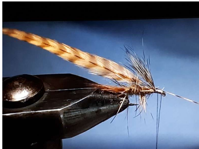
Image de gauche : relever les barbes suggérant l'aile avec 3 à 4 enroulements de fil de montage juste derrière la base des barbes. Couper à ras les excédents des barbes de l'aile qui dépassent vers l'œillet de l'hameçon.

Image de droite : attacher vers la tête le hackle de coq chinchilla roux marron après avoir retiré du rachis toutes les barbes trop souples et molles.