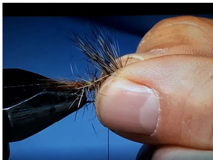
Image de gauche : enrouler 3 à 4 tours de tinsel (fil floss jaune) en spires non jointives depuis la queue jusqu'à 3-4 mm de l'œillet et l'emprisonner sous 3 tours de fil de montage. Couper l'excédent du tinsel à ras. Attention, il faut veiller à ne pas coucher les poils de lièvre de l'abdomen en enroulant le tinsel.

Image de droite : réalisation de l'aile de la mouche en prélevant 3 bonnes pincées de barbes sur la plume du coup de coq chinchilla grise. Faire une petite touffe avec ces fibres afin qu'elles soient le mieux possible à la même hauteur. Présenter la touffe de fibre pour estimer la hauteur pour que l'aile soit proportionnée à la taille de la mouche (ni trop grande, ni trop courte. En principe à peine plus longue que la hampe de l'hameçon).