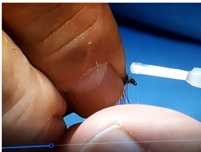
Image de droite : former la tête de la mouche en réalisant 6 ou 7 fausses clés. Couper le fil de montage à ras.