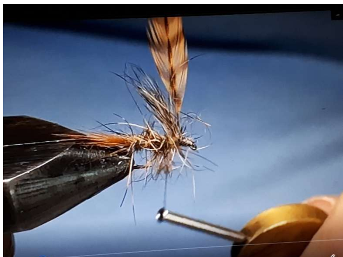
Image de droite : attacher vers la tête le hackle de coq chinchilla roux marron après avoir retiré du rachis toutes les barbes trop souples et molles.

Image de gauche : relever les barbes suggérant l'aile avec 3 à 4 enroulements de fil de montage juste derrière la base des barbes. Couper à ras les excédents des barbes de l'aile qui dépassent vers l'œillet de l'hameçon.