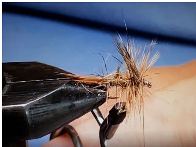
Image de gauche : réaliser un petit dubbing de lièvre et l'enrouler derrière l'aile sur 2 à 3 tours et devant sur 1 tour pour suggérer les pattes et le thorax de la mouche. Enlever le reste du dubbing du fil de montage et réaliser 2 à 3 tours avec ce dernier à l'endroit de la tête.

Image de droite : enrouler le hackle de coq chinchilla roux marron avec la pince à hackle (2 tours derrière l'aile puis en huit devant et derrière l'aile) finir par un enroulement devant l'aile. Venir emprisonner le bout pincé avec la pince à hackle sous 2 à 3 tours de fil de montage.